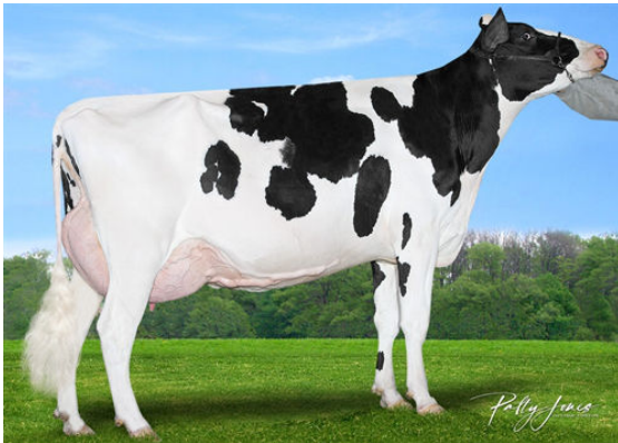
MORNINGVIEW DUKE ZIP DAM