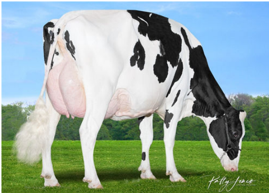
MORNINGVIEW DUKE ZIP DAM